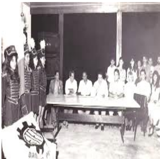
Foto - Ato de inauguração da Escola Técnica Federal de Goiás – Unidade Descentralizada de Jataí, 1988

O Instituto Federal de Educação, Ciência e Tecnologia de Goiás – Câmpus Jataí atua na microrregião do Sudoeste Goiano desde o ano de 1988. À época, esta UPC era Unidade Descentralizada da então Escola Técnica Federal de Goiás.