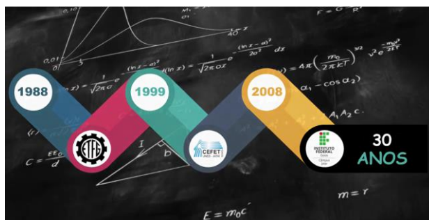
Imagem - Logomarca comemorativa aos 30 anos do Câmpus Jataí, 2018: